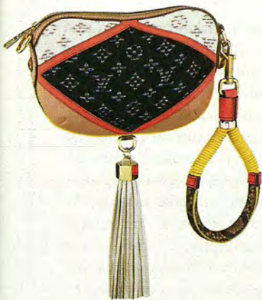
MONOGRAN NIGHTBIRD DE LOUIS VUITTON (1.400 €).