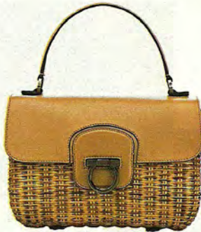
ACABADO EN PIEL Y MIMBRE, GANCIO DE FERRAGAMO (1.310 €).