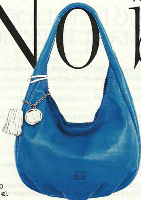
MODELO VIENTO DE LOEWE (990 €).

Puede que la mayoría de los mortales no desayunemos tostadas con caviar Beluga ni planeemos compartir nave espacial a la luna con el millonario Abramovich. Pero lo cierto es que el lujo a menor escala ya no es monopolio de quienes se apellidan Onassis o Hilton. Los expertos lo llaman la "democratización del lujo" y consiste en darse ciertos caprichos que nos hagan soñar que somos otros. Por eso, quienes cuentan con nóminas medianas disfrutan de otras lujosas emociones más asequibles. Por ejemplo, llenar su armario de complementos exclusivos.