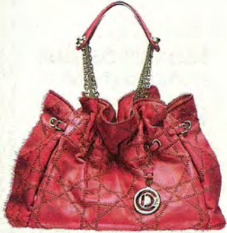
EN PIEL ROSA Y CON FRUNCE, LE30 DE CHRISTIAN DIOR (1.300 €).