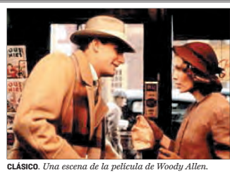
CLÁSICO. Una escena de la película de Woody Allen.

→ 19.30 Cine. Hoy ponen una de Woody Allen en El Ecolocal ■ Hay directores y películas que no pasan de moda. Por eso, no puede perderse hoy La rosa púrpura del Cairo , que se proyecta en El Ecolocal (San Luis, 17) a partir de las 19.30 horas. La entrada a la sesión es gratuita.