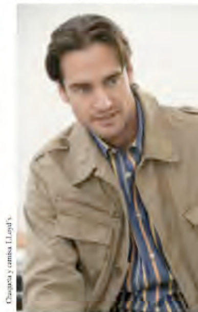
Chaqueta y camisa Lujo/ok

sidad, elegancia, y aporta equilibrio y control; lo recomendamos para trabajar, en negociaciones importantes, o en actos sociales donde se quiera transmitir una imagen cercana, pero seria. Si quiere transmitir autoridad de un modo menos opresivo que con el negro, opte por el gris que es una excelente elección. El blanco luminoso, especialmente en camisas, le aportará elegancia, pulcritud, distinción, serenidad y cercanía. Los colores tierra como beige, canela, marrón, son relajantes e invitan a la comunicación. El amanajado, al igual que el rojo, atraerá la atención y evocará las emociones intensas, así que puede usarse en poca cantidad en entrevistas laborales, y negociaciones. Por otro lado, aconsejamos evitar vestir prendas con amarillos muy intensos y brillantes, ya que aportaría una imagen muy poco seria. El rosado aunque es un