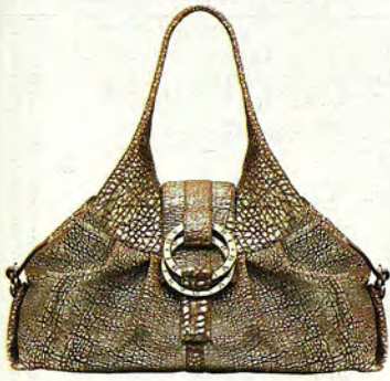
EN PIEL Y METAL, ES EL CHANDRA DE BVLGARY (1.300 €)